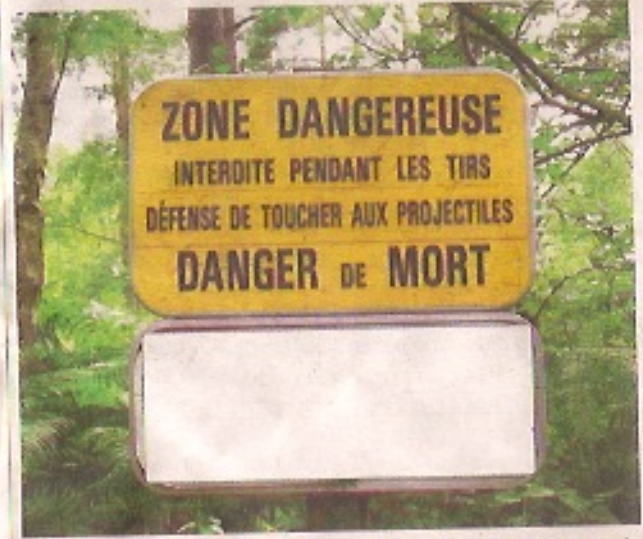
Lorsque les militaires s'exercent au tir, voilà le type de panneau dont les randonneurs doivent prendre en compte.