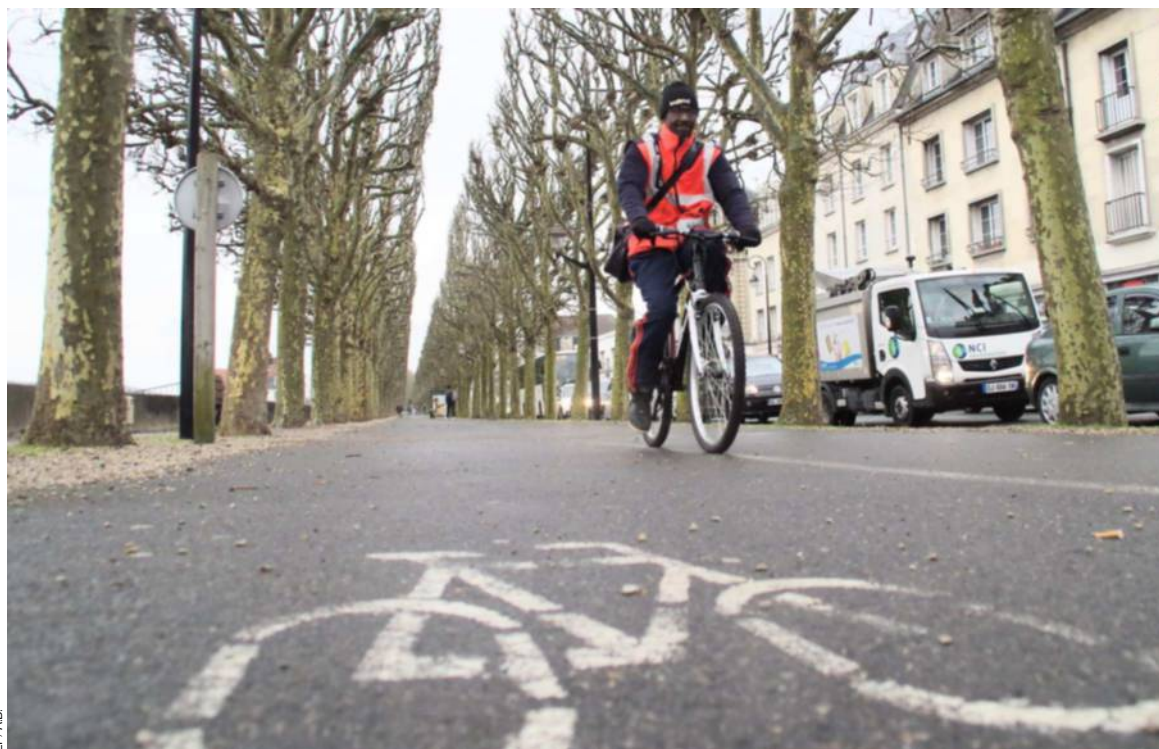
Compiègne, hier. Toutes les pistes ne sont pas aussi agréables que celle longeant le cours Guynemer. Les cyclistes reprochent notamment aux communes un manque de signalisation.