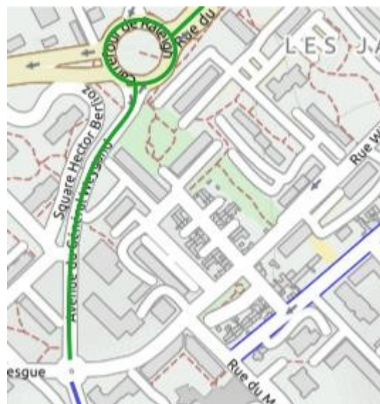
Avenue du général Weygand

Les signalisations horizontale et verticale devront bien sûr être étudiées dans le détail sur le parcours.