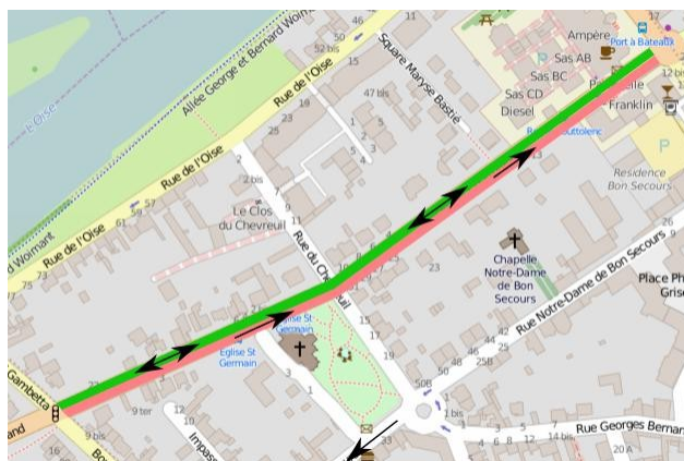
Rues Couttolenc et Gréban

La circulation automobile se ferait vers le centre-ville uniquement, l'autre sens étant déjà attribué à la rue Notre-Dame de Bon Secours.