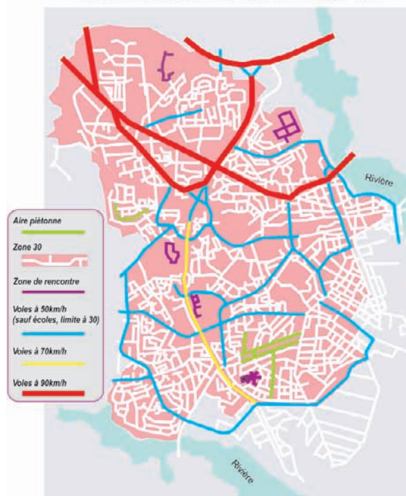
Plan théorique d'un réseau de voirie hiérarchisé