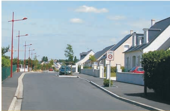
Rue résidentielle

La description de ces quatre situations n'est pas exhaustive.