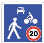
B52 Entrée d'une zone de rencontre