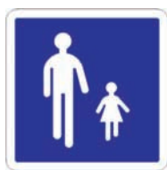
B54 Entrée d'une aire piétonne