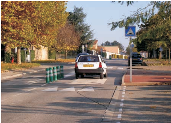
Rue de distribution du quartier