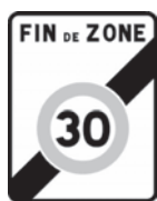
Panneau B51 Sortie d'une zone 30

La fin de la zone 30 peut être annoncée par un des panneaux suivants :