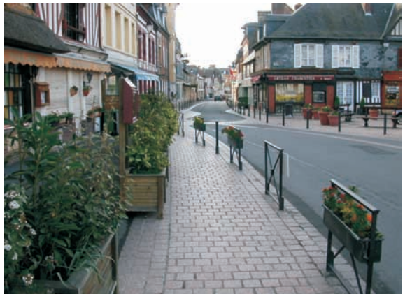
Section d'axe de transit