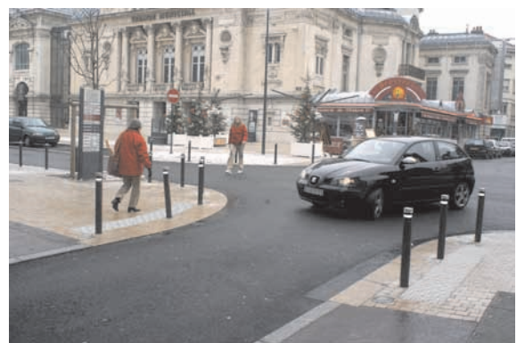
Rue commerce de proximité